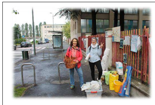
Le prime lavoratrici GA della Civil Week arrivano...

GenitoriAttivi e cittadini del quartiere in occasione della Civil Week dell'Italo Calvino