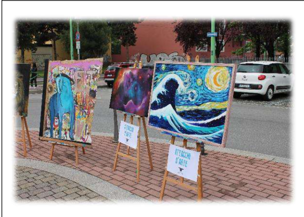
Tra attacchi d'arte e...