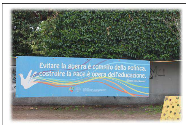
Si srotolano gli striscioni...