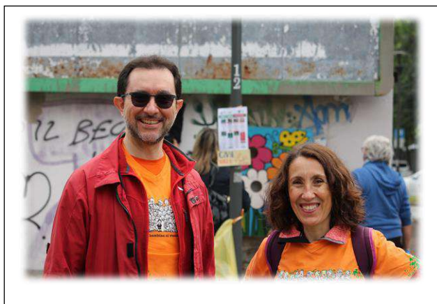
Se Presidente e Tesoriera dei GA sorridono così, vuol dire che le cose vanno bene...eheheh