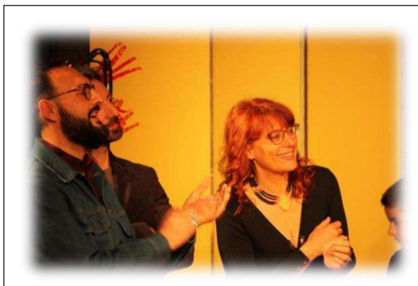
lo spettacolo teatrale "Tutti insieme"