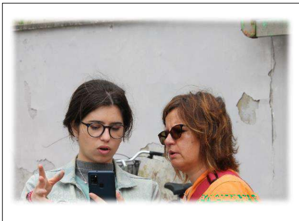
come fare una storia su Instagram ben fatta...