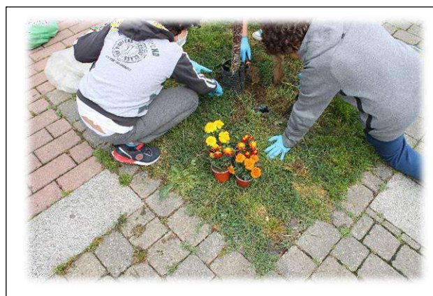
Non solo pittori, ma anche giardinieri all'opera...