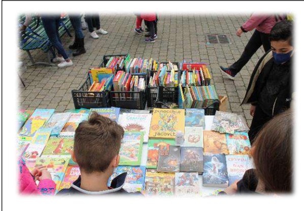
Mercatino dei libri un successone!! Gestito splendidamente dai ragazzi...