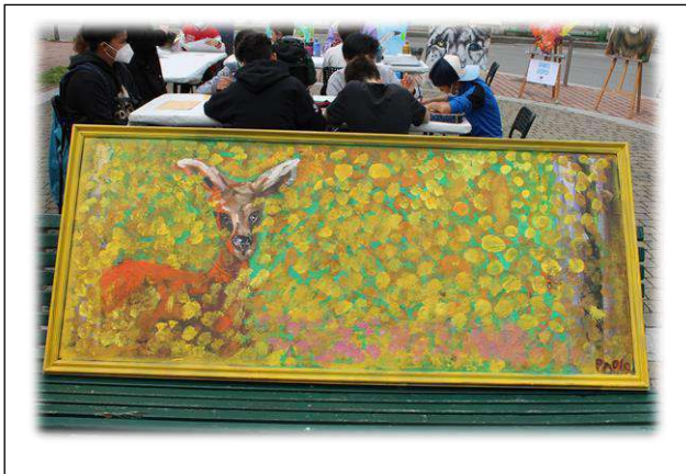
Bambi ci guarda...