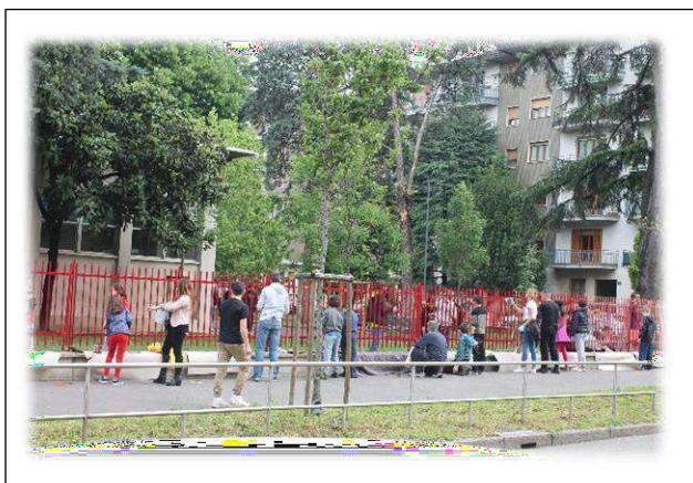
L'altra squadra di pittori in Mattei prosegue il lavoro a spron battuto...