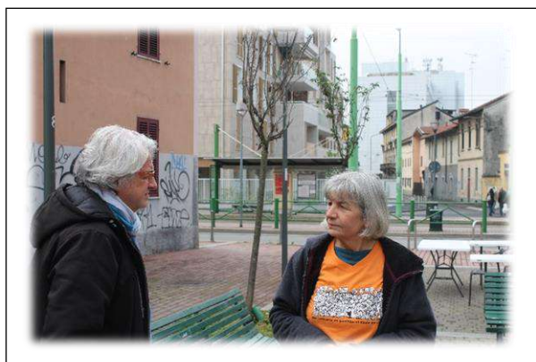
Notare il muro delle case a sinistra deturpato, ma Sanga e GA avevano già tutto programmato...