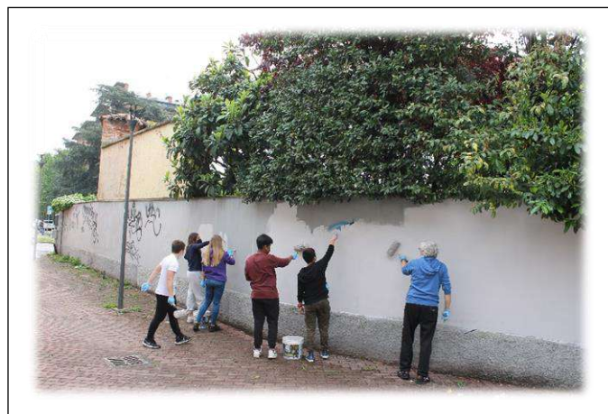
Altri pittori all'opera...