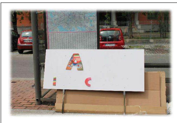
...e il cartellone comincia magicamente a prender forma...