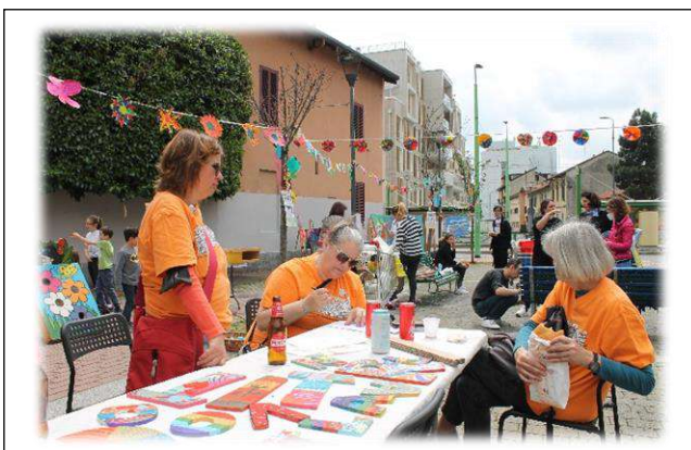
La pausa pranzo è arrivata...