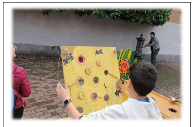
I giochi sono aperti