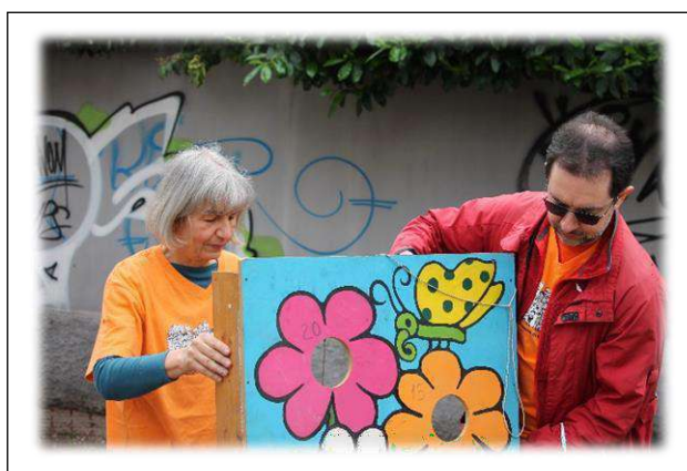
Ancora Presidente e Vicepresidentessa che fanno lavori più disparati, come allestimento giochi, tutt'altro che digitali per i ragazzi