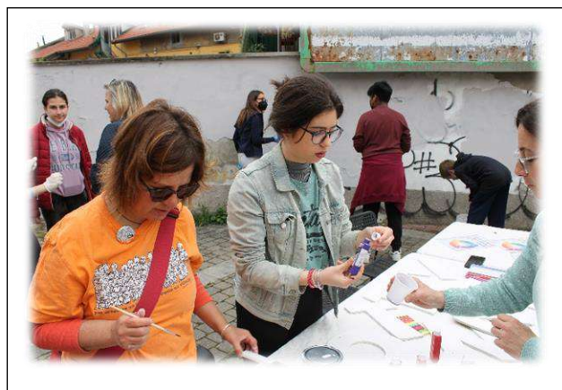
Ne abbiamo di viola?