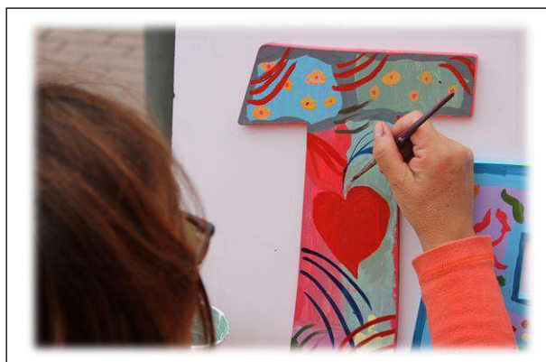
Un ultimo "tocco al cuore" della T...