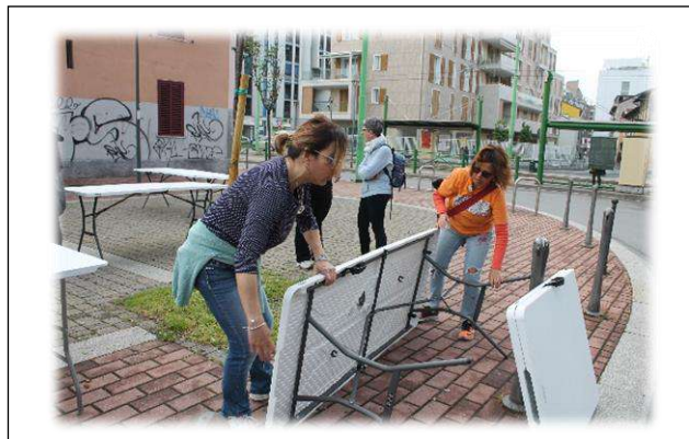
Con grande energia le lavoratrici si apprestano ad affrontare la giornata...