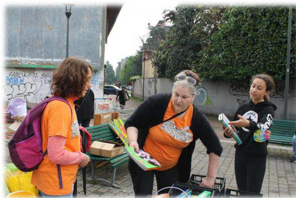
Si comincia ad allestire la libreria