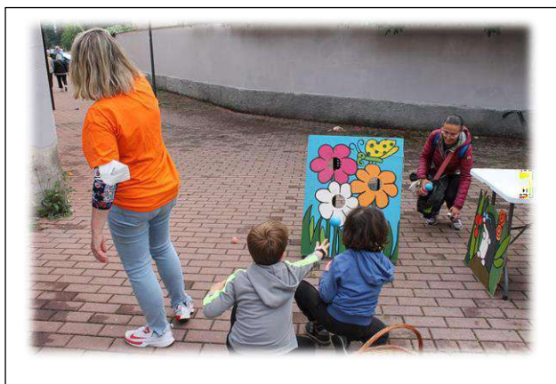
Centra il fiore...