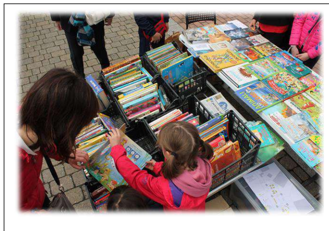
"Piccole lettrici crescono" ...