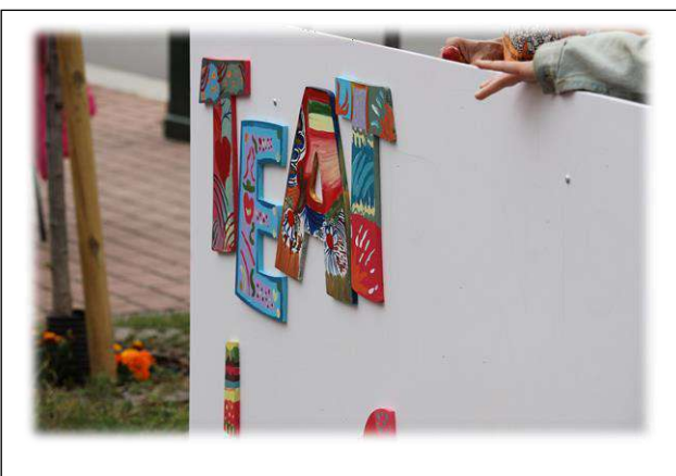
Il tabellone sempre più corposo...