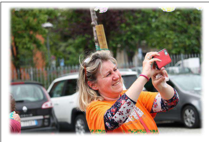
...messa a punto dei telefoni per le foto...