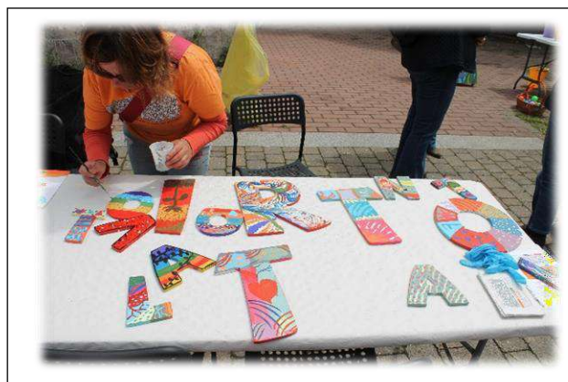
Le lettere si animano di colori asciugandosi al sole...