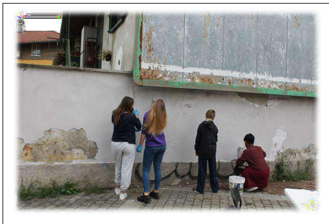
Il lavoro dei ragazzi e professori comincia a dare i suoi frutti...